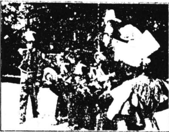
L'infanterie de la principauté d'ÉLISABETHVILLE

De part son originalité architecturale, par sa composition socio-économique et culturelle, le lotissement se démarque de ses deux communes gestionnaires restées profondément rurales. Le fait même de choisir un nom de baptême, et non des moindres, de faire renommer la gare d'Aubergenville, d'organiser des animations attirant notables parisiens et belges dénote d'une certaine « indépendance politique ».